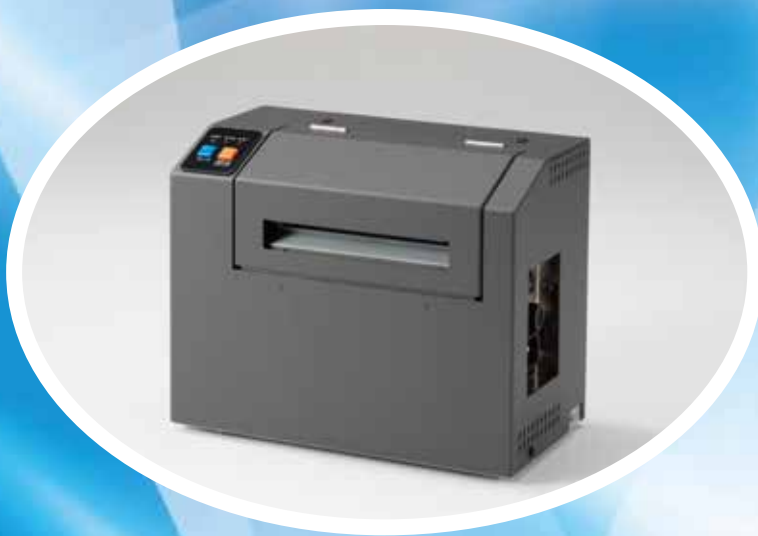
E-40C (カッター内蔵モデル)